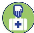
Diefstal eigendommen ziekenhuis