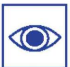
Toezichthouders in/rond zorginstelling