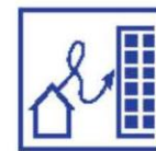
Sociaal veilige woon/werk-route