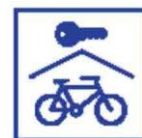
Afsluitbare of bewaakte fietsenstalling