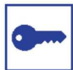
Afsluiten (delen van het gebouw)