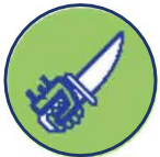
Bedreiging met wapen