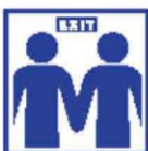
Afspraken gezamenlijk verlaten gebouw