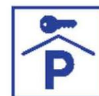
Afsluitbare of bewaakte parkeerplaatsen