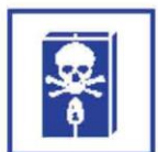
Opbergen gevaarlijk materiaal