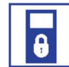
Fysieke beveiliging in- en uitgangen en ramen