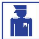
Fysieke aanpak kwetsbare plekken