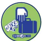
Diefstal persoonlijke eigendommen